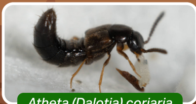
Atheta (Dalotia) coriaria