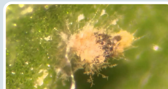
Beauveria bassiana , Paecilomyces sp.