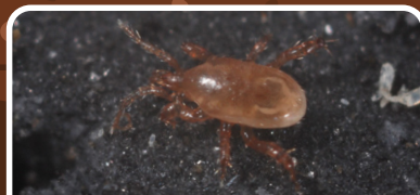
Hypoaspis (Gaeolaelaps) aculeifer