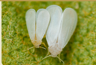
TRIALEURODES VAPORARIORUM BĚLÁSEK SKLENÍKOVÝ