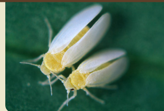
BEMISIA TABACI BĚLÁSEK TABÁKOVÝ