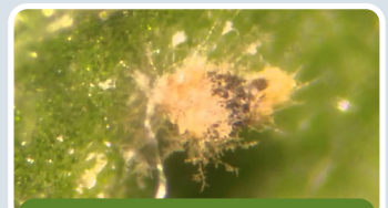
Beauveria bassiana, Paecilomyces sp.