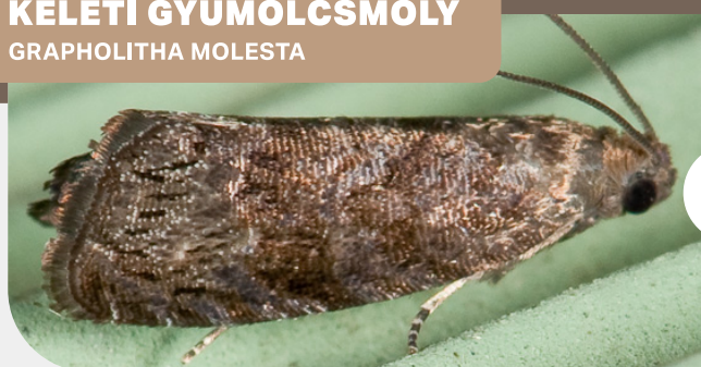
KELETI GYÜMÖLCSMOLY GRAPHOLITHA MOLESTA

Két különböző kártevő, amelyek hasonló tüneteket okoznak az őszibarack ágain és termésén.