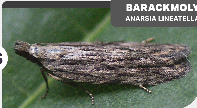
BARACKMOLY ANARSIA LINEATELLA