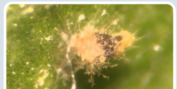
Beauveria bassiana, Paecilomyces sp.