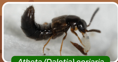
Atheta (Dalotia) coriaria